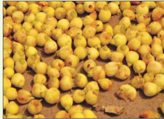
महुआ फूल संग्रहण की पारंपरिक विधि से संग्रहित फूल एवं गुणवत्ता