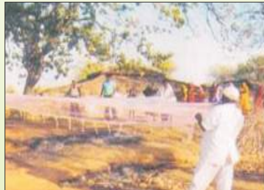
महुआ संग्रहण का वैज्ञानिक तरीका