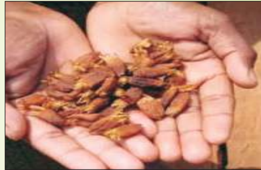
महुआ फूल सुखाने की विधि पर गुणवत्ता का असर