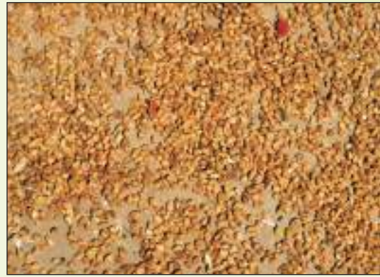
महुआ फूल सुखाने की पारंपरिक विधि