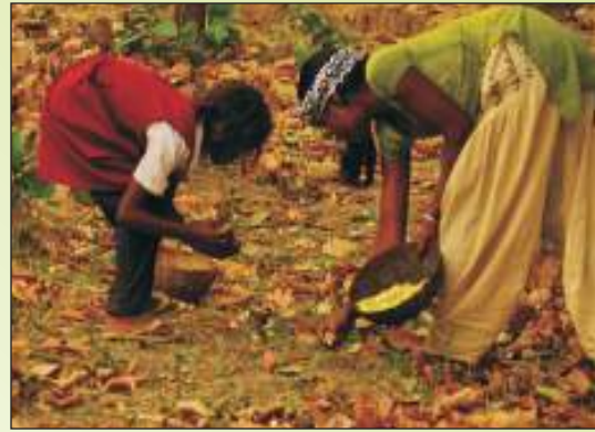
महुआ फूल संग्रहण की पारंपरिक विधि