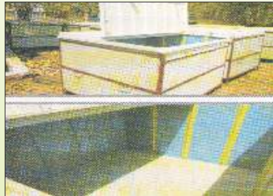
महुआ फूल सुखाने की वैज्ञानिक विधि