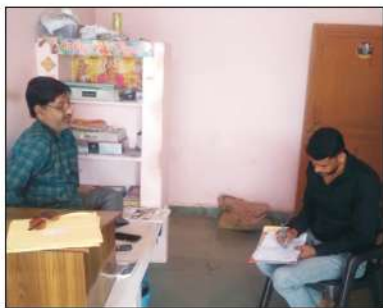
फोटो-1: लघुवनोपज व्यापारी, कराहल, जिला श्योपुर से जानकारी प्राप्त करते हुये

स्थानीय व्यापारी - श्योपुर, शिवपुरी एवं कराहल