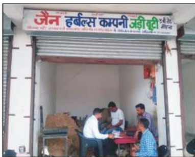
फोटो-2: लघुवनोपज व्यापारी, मोहना, जिला ग्वालियर से जानकारी प्राप्त करते हुये