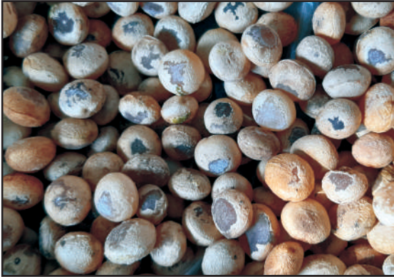
निर्मली बीज ( Strychnos potatorum )