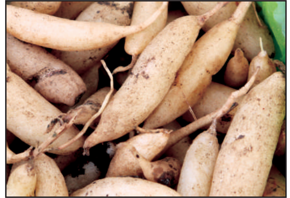
सफेद मूसली जंगली ( Chlorophytum borivilianum )