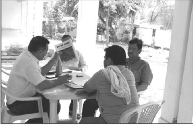
वनोपज व्यापारी, ग्राम मझगवा, जिला सतना से जानकारी प्राप्त करते हुये