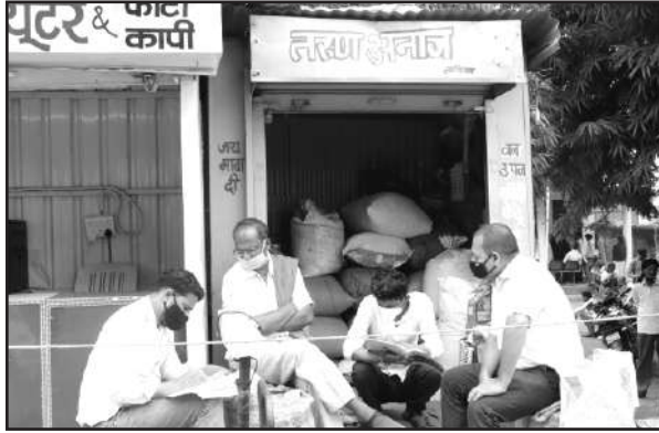
वनोपज व्यापारी, तामिया बाजार, जिला छिंदवाड़ा से जानकारी प्राप्त करते हुये