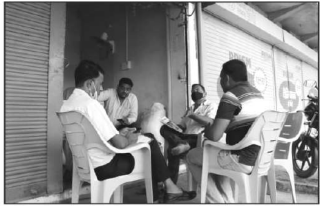
वनोपज व्यापारी, ग्राम मझगवा, जिला सतना से जानकारी प्राप्त करते हुये