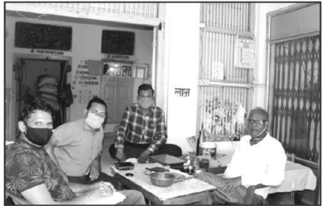
वनोपज व्यापारी, जिला उमरिया से जानकारी प्राप्त करते हुये