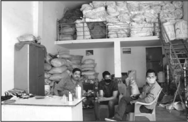
वनोपज व्यापारी, जिला उमरिया से जानकारी प्राप्त करते हुये